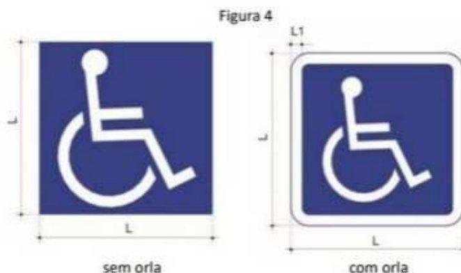
Quadro 1 – Características do Símbolo Internacional de Acesso (SIA)

- Rever as sinalizações/dimensões do Símbolo Internacional de Acesso – SAI e das numerações das vagas PNE, conforme Resolução Contran nº 965/2022 (anexos) e imagens a seguir: